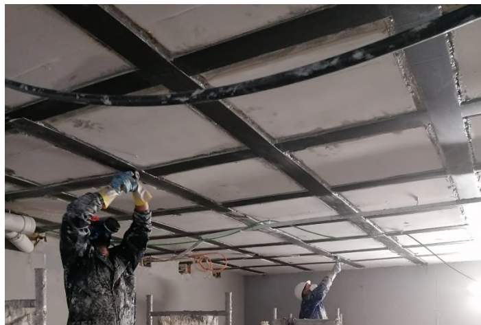
Tareas de aplicación MasterBrace LAM