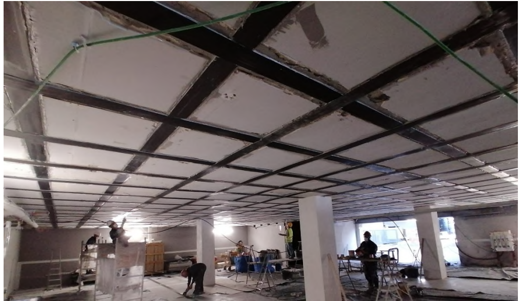
Sistema de refuerzo MasterBrace LAM aplicado